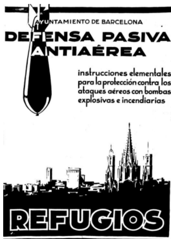
Cartel del Ayuntamiento de Barcelona

Y a partir de ese momento los bombardeos no dejaron de perfeccionarse. Víctimas y más víctimas civiles que se suman en todo el mundo. La guerra total no distingue. No quiere. Se convierten en daños colaterales o en muertos sin nombre ni derecho al recuerdo. Ahora los niños vuelven a jugar en ese jardín, de nuevo urbanizado, civilizado, y en sus bancos se sientan los mayores a tomar el sol tibio de primavera. En un extremo, la reconstrucción de la entrada del refugio es un bucle que nos permite retroceder en el tiempo y donde más de uno se debe haber enfrentado al vértigo de volver a esa lejana y dura infancia.●