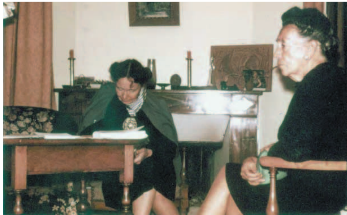
UNIVERSITAT DE GIRONA. BIBLIOTECA. FONS BERTRANA